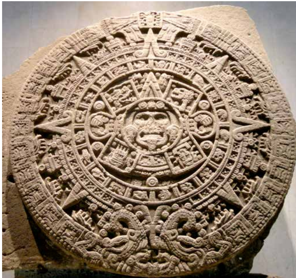
Piedra del Sol o calendario azteca