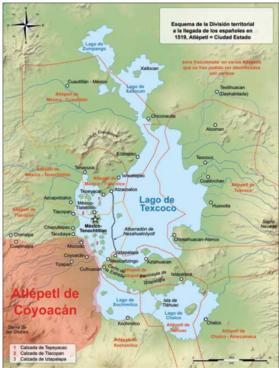
Cuenca de México en el Posclásico tardío

Tezozómoc fue el gobernante tepaneca que llevó a Azcapotzalco a su máximo apogeo, al conseguir que muchos pueblos tributarios trabajaran y guerrearan para su beneficio y, además, en las regiones conquistadas más importantes establecía a sus hijos como gobernantes y a sus hijas las casaba con los señores menos importantes