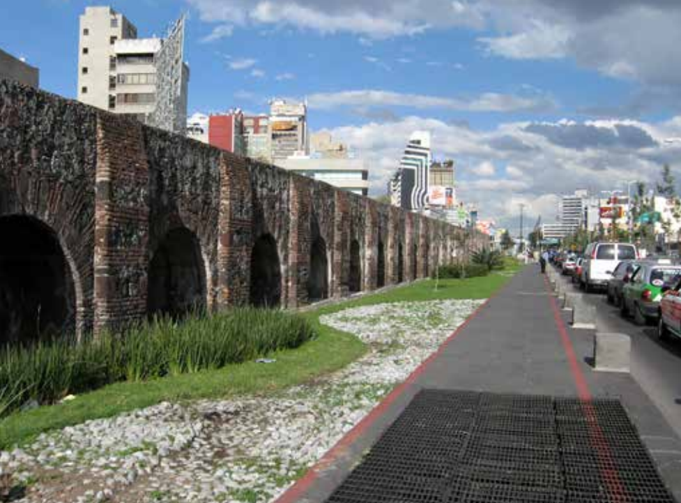
Acueducto de Chalpultepec

la calzada que llegaba a Chapultepec, donde había abundantes manantiales que surtían de agua las fuentes de las innumerables plazas, donde los habitantes disponían de ella libremente, y el interior de los palacios y casas nobles, a través de cañerías de arcilla.