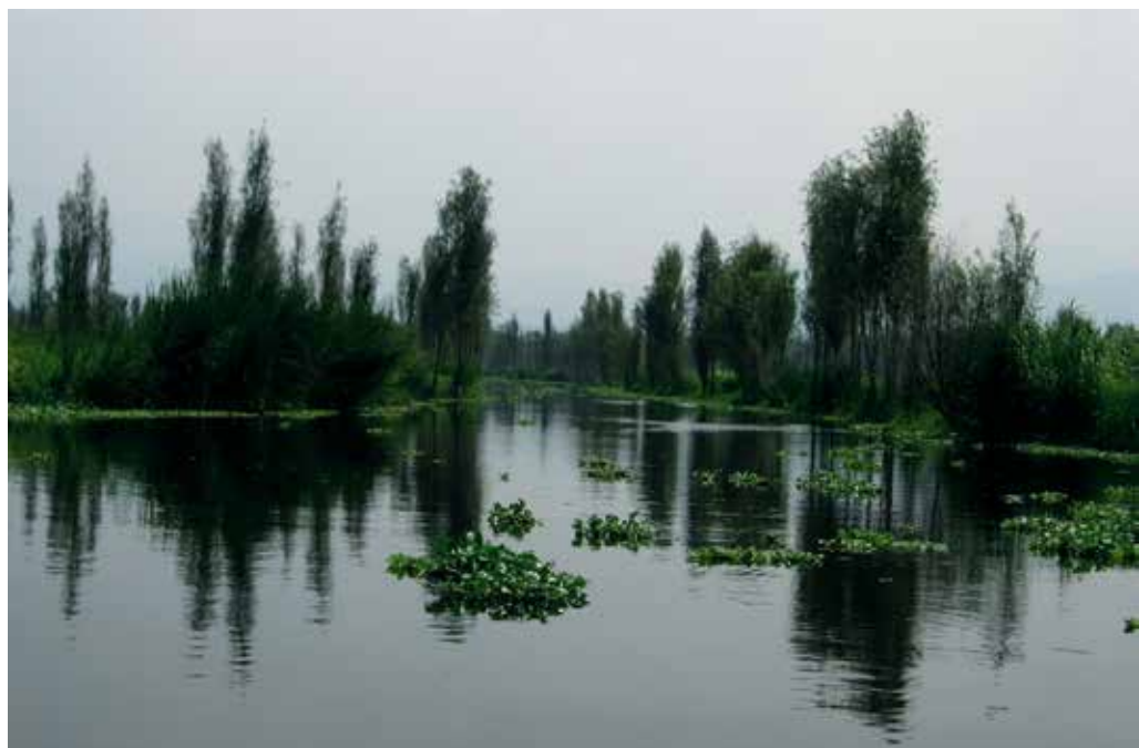
Zona chinampera de Xochimilco

Durante la primera etapa Tenochtitlán creció a buen ritmo, lo que obligó a