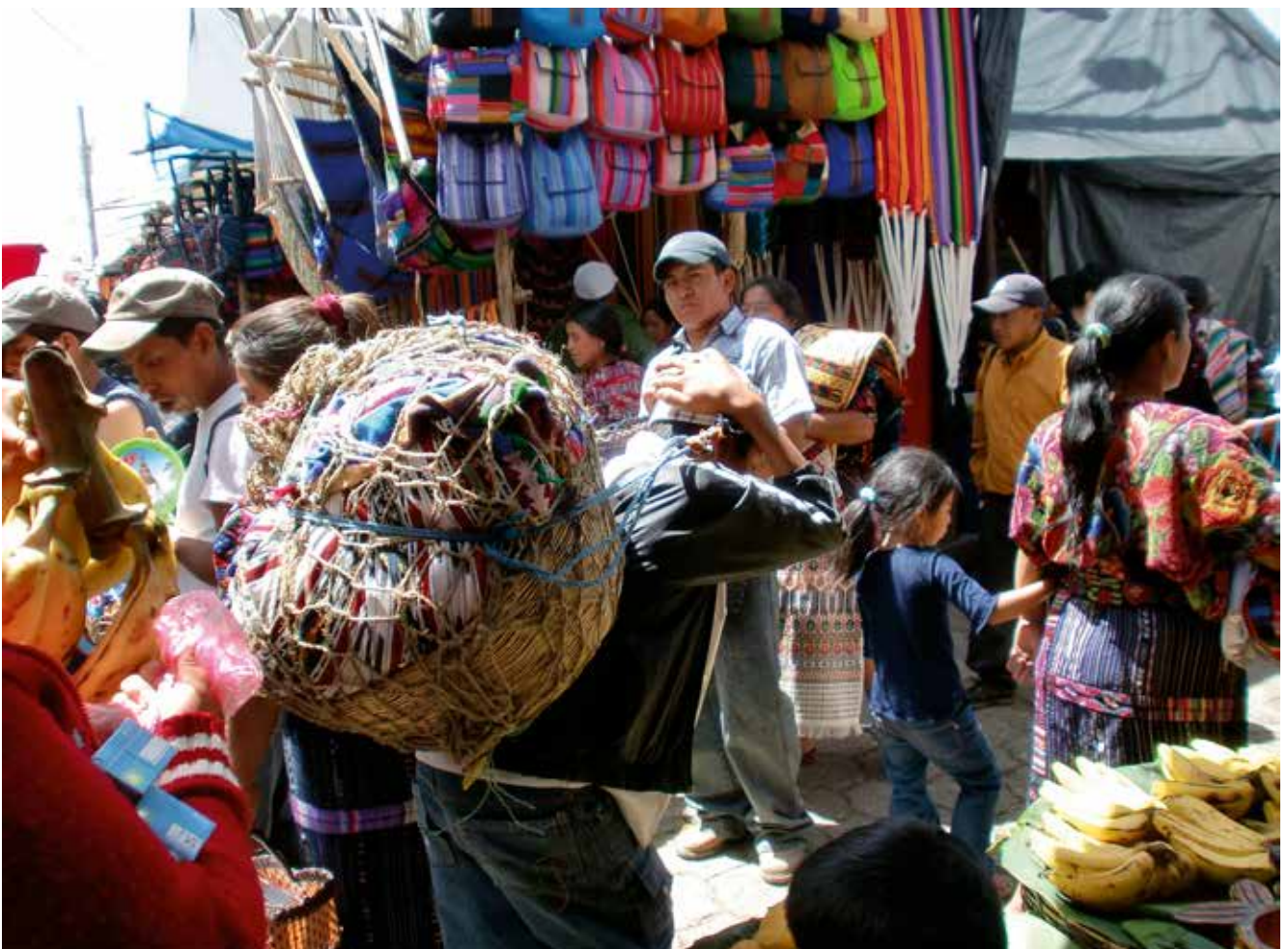
Tlameme o cargador en Chichicastenango

Aunque en los hogares las mujeres se encargaban de la educación de sus hijos, el Estado tenía un buen sistema de enseñanza. Para los nobles había