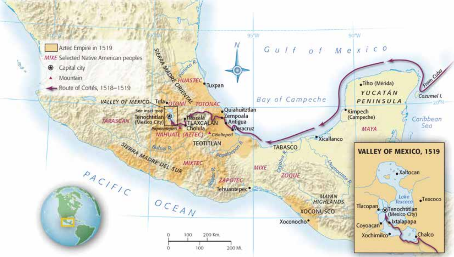
Imperio azteca en 1519

guarniciones que los aztecas levantaban.