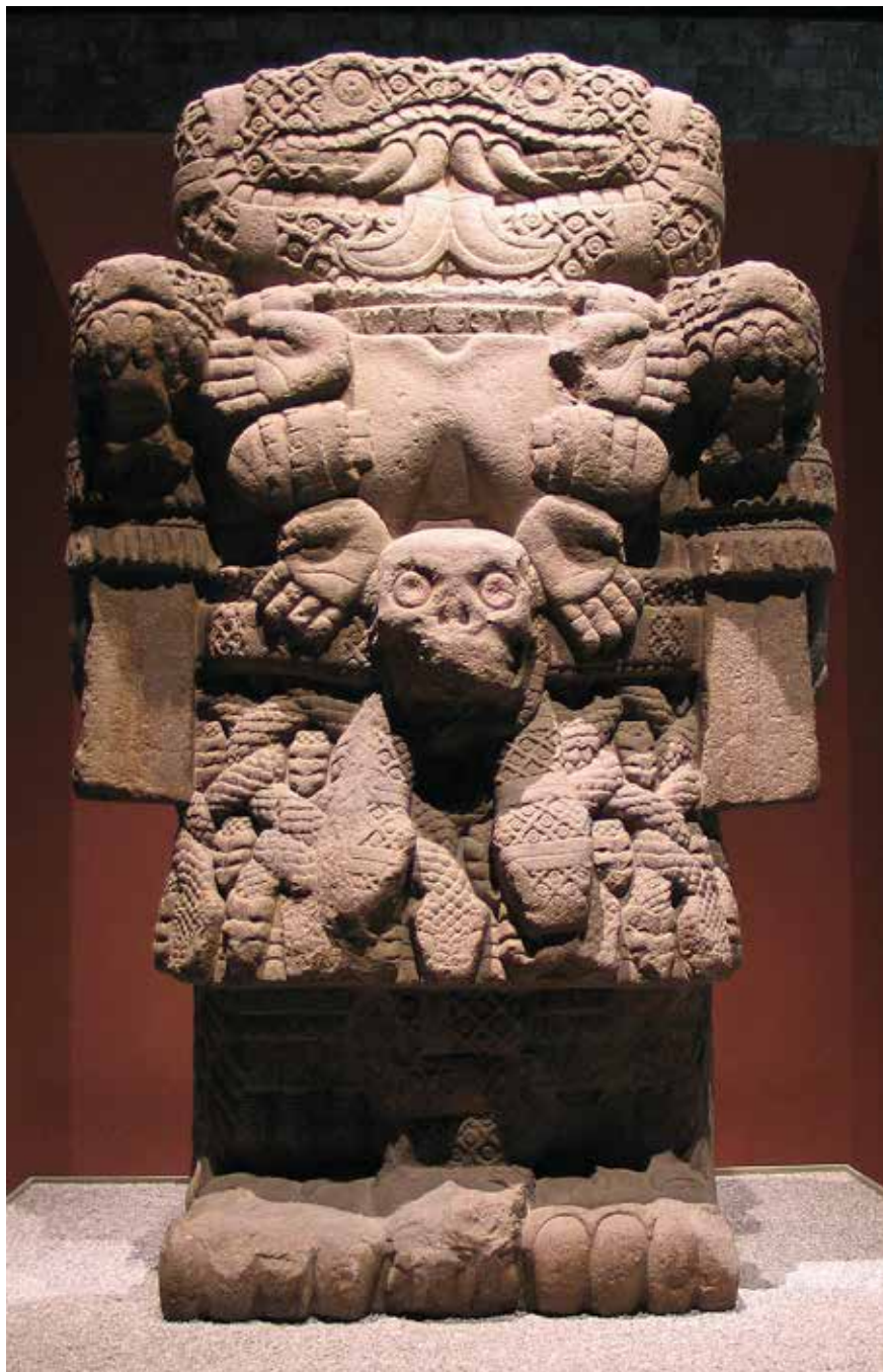
Coatlicue, madre de los dioses mexicas

diferentes tipos de escuelas a las que acudían desde pequeños, donde aprendían historia, religión, retórica, astronomía, cartografía y a escribir, e interpretaban los libros antiguos. Con estos conocimientos se preparaban para ser buenos gobernantes o desempeñar altos cargos en la vasta Administración. La educación la completaban en el telpochcalli o escuela militar, junto al resto de los niños comunes. Esta formación era obligatoria para todos y estaba costeada por el Estado. Aquí se formaban como guerreros, que era la ocupación principal de los aztecas y la