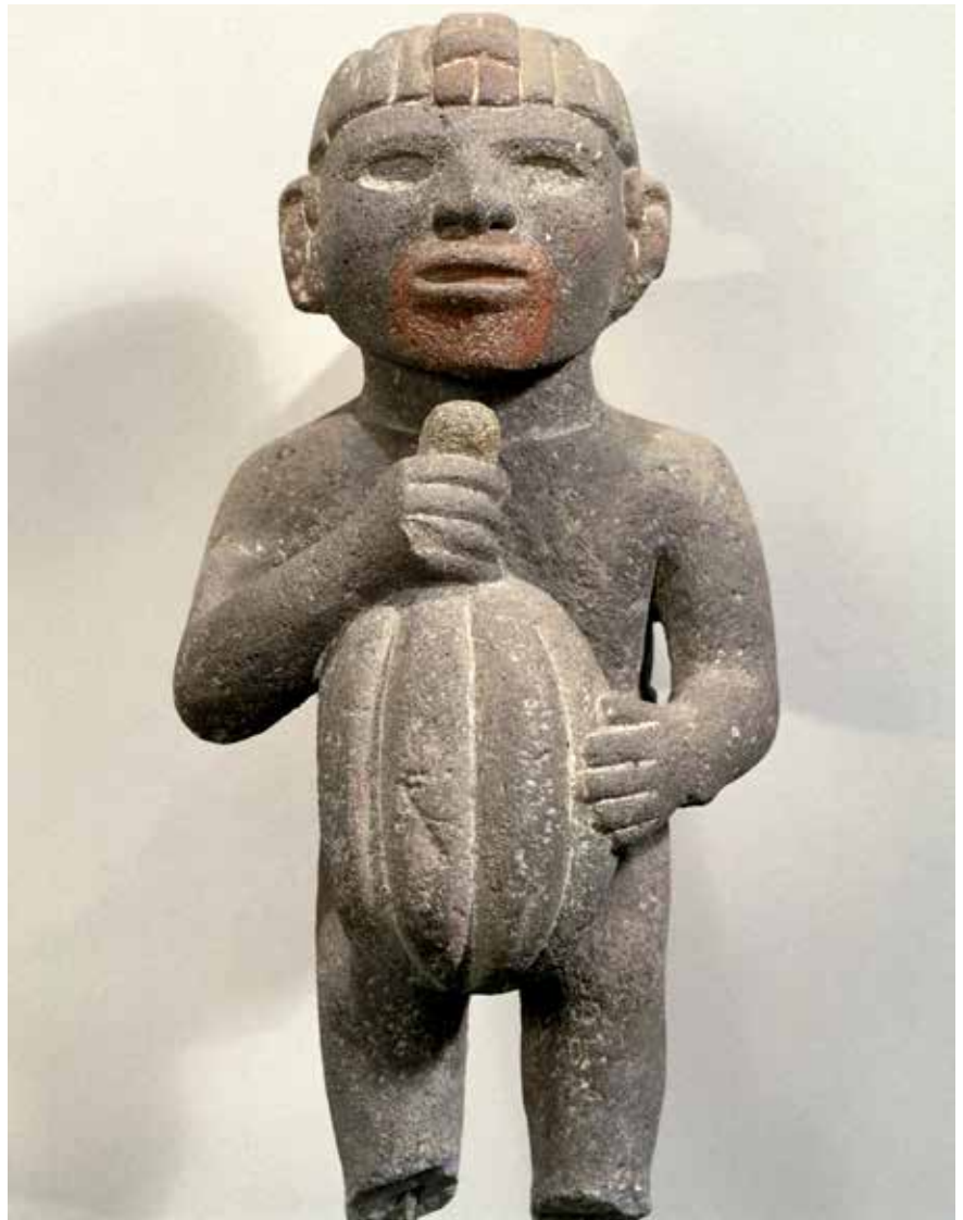
Escultura azteca. Hombre con cacao

Las mujeres se encargaban del hogar y preparaban los alimentos para la familia, los hombres trabajaban en el campo o en la ciudad y los niños se educaban en el hogar hasta que tenían unos 15 años. En ese momento tenían la obligación de ir a la escuela militar, que era obligatoria y estaba financiada por el Estado.