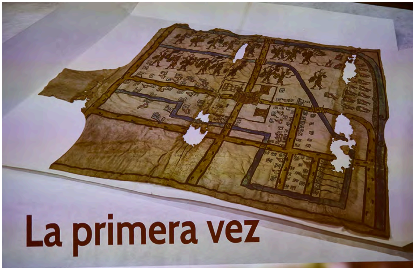
Lámina de la presentación del equipo de que trabajó en el Mapa de Popotla. GINNETTE RIQUELME QUEZADA

Lejos de rendirse y bajar los brazos, la académica ha salido al paso para acallar a todas esas voces que especulan y cuestionan la existencia de este códice, posiblemente del siglo XVI. Asimismo, ha apelado a las autoridades a cargo del patrimonio del país a la necesidad de que se les facilite más elementos de investigación que les permitan corroborar los resultados de este primer estudio multidisciplinario.