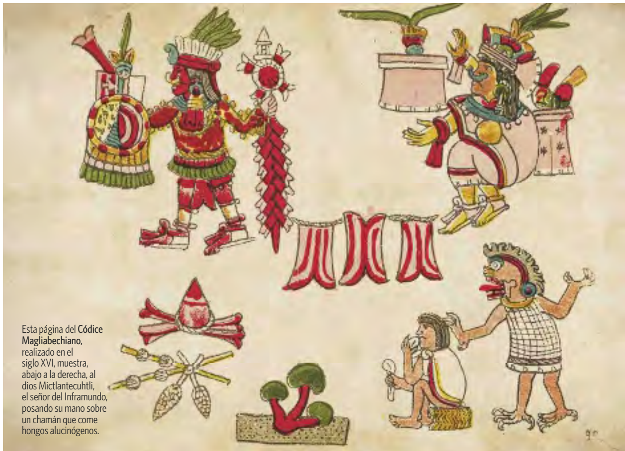
Esta página del Códice Magliabechiano, realizado en el siglo XVI, muestra, abajo a la derecha, al dios Mictlantecuhtli, el señor del Inframundo, posando su mano sobre un chamán que come hongos alucinógenos.