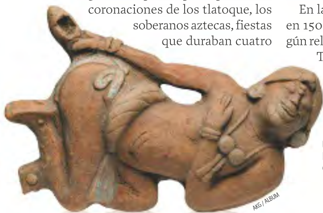
Un hombre se aplica un enema ritual. Figurilla maya. 600-900. Museo de Arte del Condado de Los Angeles.

Como las drogas actuales, las plantas psicoactivas de los amerindios tenían efectos secundarios poco agradables, pues la mayoría de las veces el éxtasis llegaba precedido de náuseas y vómitos. Por ello se buscaron formas alternativas de consumirlas. Una de ellas fue administrarlas por el recto, en forma de enema. Aunque esta práctica tuvo gran difusión por toda América, arraigó especialmente entre los mayas, quienes nos han dejado numerosas representaciones gráficas al respecto. El enema consistía en una infusión de peyote, tabaco o cualquier otra planta alucinógena, que a menudo se potenciaba